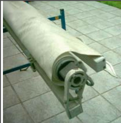
Bild 331 Markise auf Böcken

Legen Sie die Markise auf vorbereitete Böcke. Sie sollten gut an die beiden Inbusschrauben kommen mit denen das Markisengetriebe an der Markisenwelle befestigt ist.