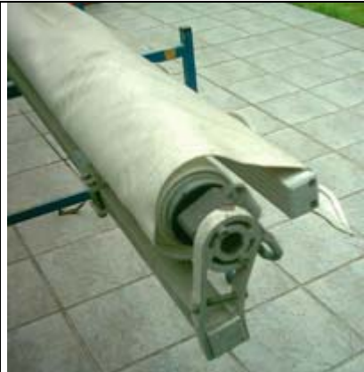
Bild 331 Markise auf Böcken

Legen Sie die Markise auf vorbereitete Böcke. Sie sollten gut an die beiden Inbusschrauben kommen mit denen das Markisengetriebe an der Markisenwelle befestigt ist.