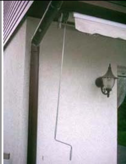
Bild 329 Markise mit Kurbel

Danach die Markise wieder einfahren und die Kurbel auf die Seite legen.