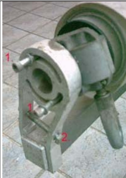
Bild 322 Markise geöffnete Schrauben

Danach lockern Sie die Schraube (Nr.: 2.) für den Markisenbock.